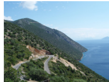
Flink klimmen op sfeervol Ithaka