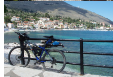
Visjes eten in Fiskardo en Ag. Efimia