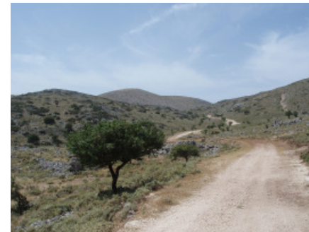
Eenzaam & onverhard achter de bergen

De klim naar de bergdorpjes Faraklata en Dilinata is al vervelend maar de nieuwe weg de berg op is echt steil en heet. De teller geeft ruim 800 m aan wanneer ik de onverharde weg inrij, langs een eenzaam kerkje, een simpele boerderij en wat loslopende geiten. Ik sla te vroeg rechtsaf en sta weldra bovenop de Oros Evmorfias van 1.048 m. Teruggaan is geen optie maar dat betekent wel die haarspeldbochten omlaag. Wat is dat steil en glibberig zeg en ik ben blij wanneer ik ongeschaafd Dilinata inrij. Maar wat was het mooi! Daarna kan ik weer voluit naar beneden, richting de oude dam naar het terras. Bij het eerste biertje zie ik de kop van een flinke schildpad boven het water uitkomen.