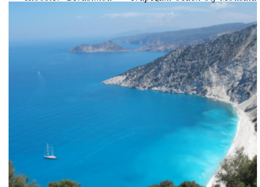
Het turquoise Mirtos Beach en Argos