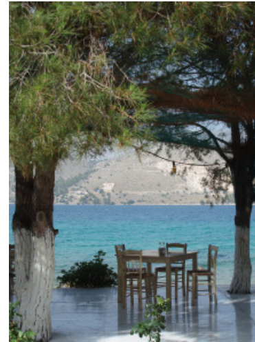
Uitnodigend terras aan baai van Argostoli