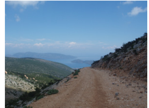
Klimmen naar 1.000 m en uitzicht op Sami en Ithaka