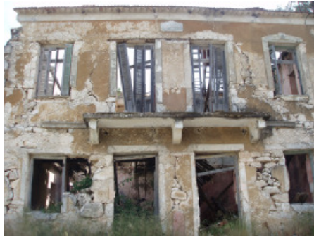
Sporen van de aardbeving bij Fiskardo