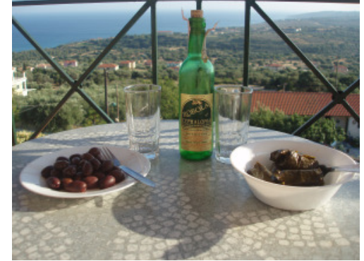
Bijkomen met Robolo vanaf balkon in Mousata